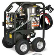
Modèle ultra compact : 39" L x 28" l x 42" H

Ces nettoyeurs portables à essence et à chauffage au diesel sont construits à partir de composantes de haut rendement, montés sur un châssis robuste en acier. Ces appareils compacts à essence de style berceau sont parfaitement à l'aise sur des terrains accidentés. Tous certifiés selon les normes UL et CSA, ils sont